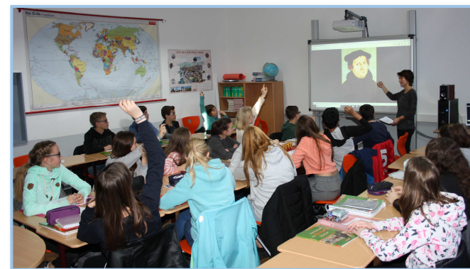
Bilingualer Unterricht im Fach Geschichte

Seit dem Schuljahr 2015/16 gibt es am Aldegrevier-Gymnasium einen deutsch-englischen Bildungsgang, kurz: Bili-Zweig — wie es sich für eine gute Europaschule gehört. Pro Jahrgang werden ein bis zwei bilinguale Klassen eingerichtet, in denen die Schülerinnen und Schüler auch außerhalb des eigentlichen Fremdsprachenunterrichtes die Möglichkeit bekommen, ihre Englischkenntnisse erheblich zu erweitern. Die bilingualen Klassen erhalten zunächst zwei Jahre lang erweiterten Englischunterricht. Ab dem 7. Schuljahr findet der Unterricht in den Fächern Erdkunde und Geschichte in englischer Sprache statt. Beim Übergang in die Oberstufe besteht die Wahl, den bilingualen Bildungsgang weiterzuführen oder in den regulären Zweig zu wechseln und ausschließlich das ‚normale‘ Abitur zu erwerben. Falls der bilinguale Bildungsgang in der Oberstufe fortgesetzt und Englisch sowie ein